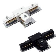
AV2159BSAA AV2159NSAA Innesto giunzione "T"