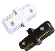
AV2103BSAA AV2103NSAA Innesto giunzione "I"