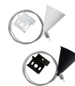
AV2105BSAA AV2105NSAA Kit di sospensione