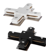
AV2171BSAA AV2171NSAA Innesto giunzione "X"